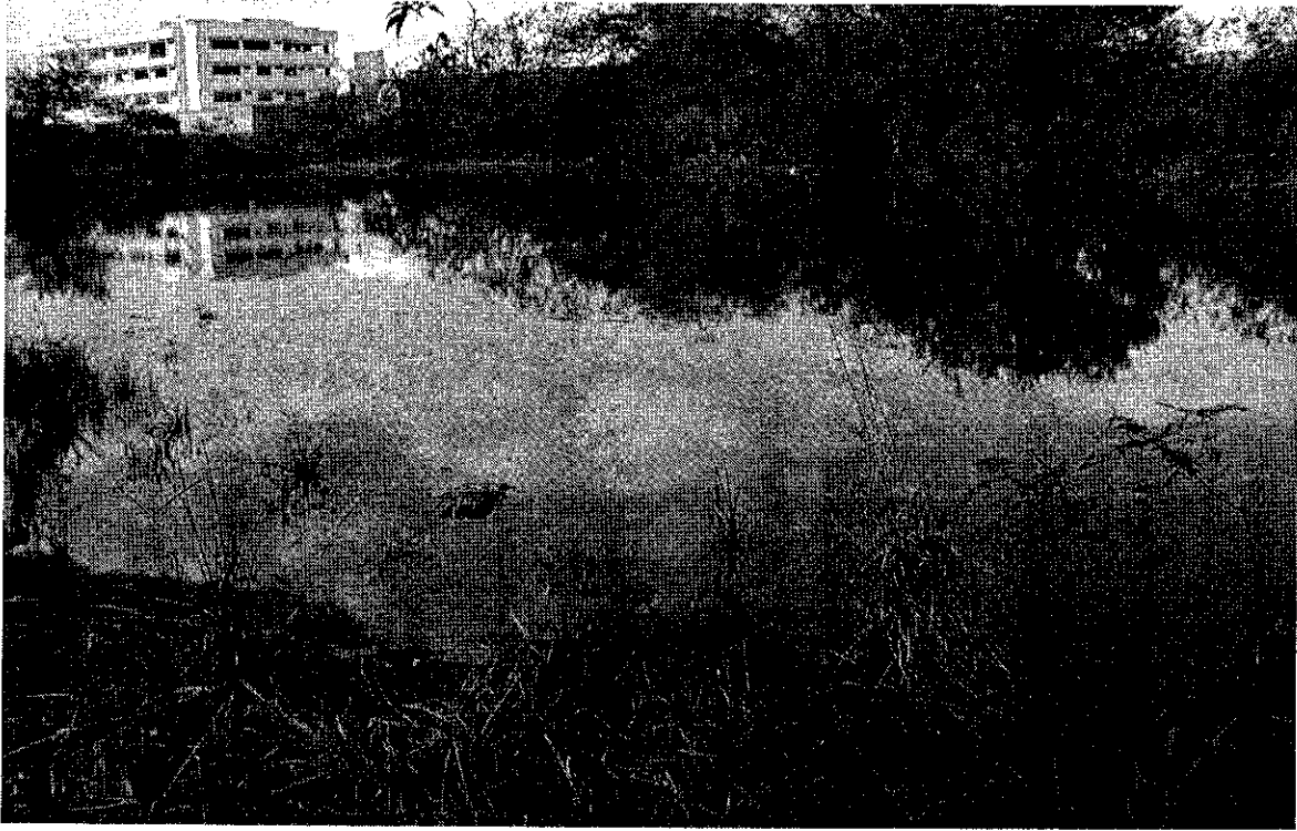
Humedal Jardín Botánico Neiva- Visita CGR – Octubre de 2016