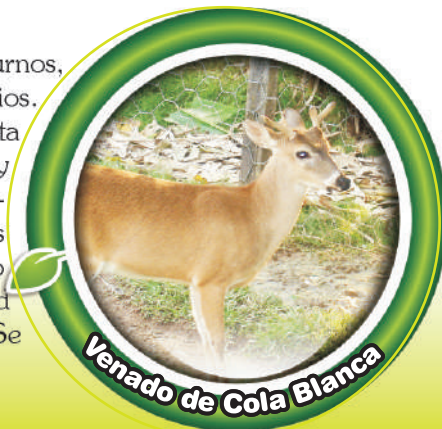
Venado de Cola Blanca

De hábitos diurnos o nocturnos, terrestres, herbívoros y solitarios. Caracterizados por su corta cola, patas estilizadas y delgadas, pelaje café-grisáceo, cuernos ramificados o sin ramificaciones, peso desde 50 a 10 Kg, longitud desde 130 a 45 cm de largo. Se