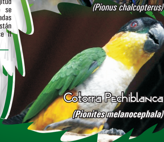
Cotorra Pechiblanca ( Pionites melanocephala )