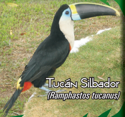
Tucán Silbador ( Ramphastos tucanus )