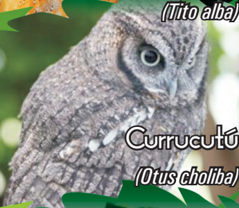
Currucutú ( Otus choliba )