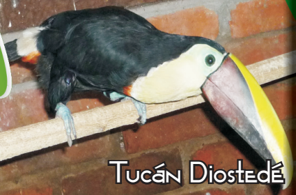
Tucán Diostedé ( Ramphastos swainsonii )