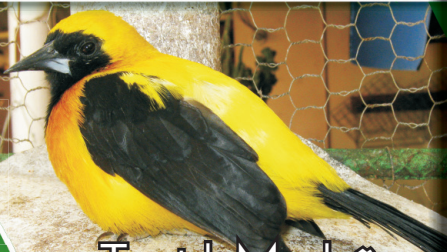
Turpial Montañero ( Icterus chrysater )

Aves diurnas, solitarias o en bandadas, vuelo fuerte y rápido. Turpial Montañero ( Icterus chrysater ): de plumaje amarillo, cuello, alas y cola negro. Turpial Amarillo ( Icterus nigrogularis ): de color amarillo limón, cola y alas negras con línea blanca. Arrendajo Común ( Cacicus cela ): plumaje de color negro, plumas de rabadilla y alas amarillas. Especies con longitud de 22-28 cm y peso de 70-100 gr y no se encuentran reportadas por la UICN y el CITES.