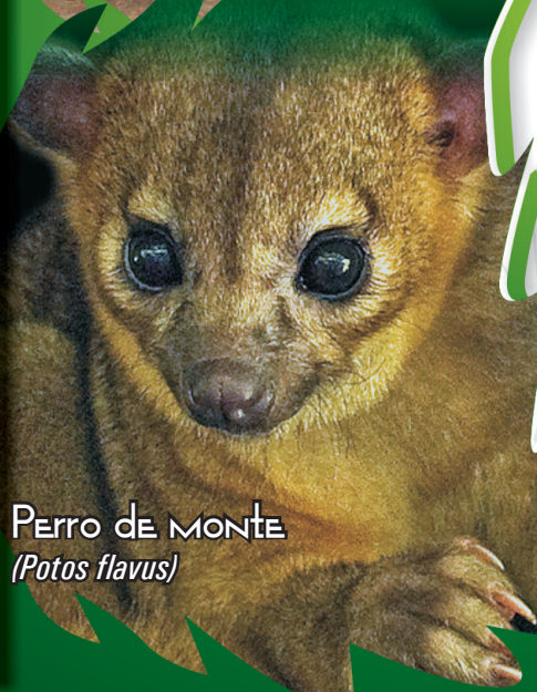
Perro de Monte ( Potos flavus )