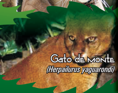
Gato de Monte ( Herpailurus yaguarondi )