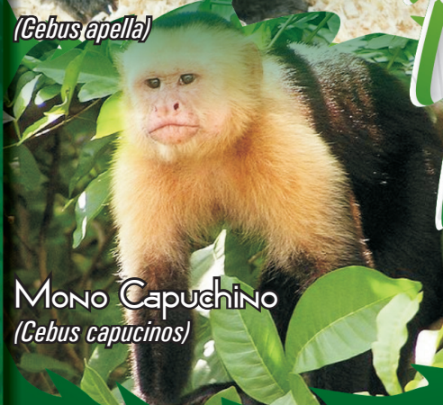
Mono Capuchino ( Cebus capucinos )