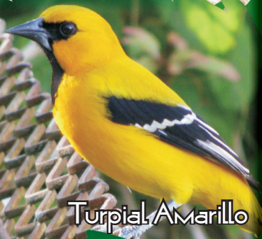
Turpial Amarillo ( Icterus nigrogularis )