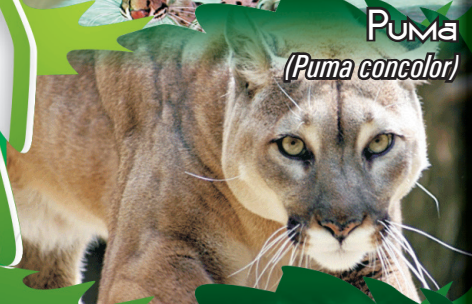
Puma ( Puma concolor )