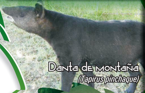
Danta de montaña ( Tapirus pinchaque )

Danta de Montaña ( Tapirus pinchaque ), Danta Común ( Tapirus terrestris ) y Danta Centroamericana ( Tapirus bairdii ): Nocturnos, herbívoros, cuerpo robusto, extremidades posteriores con tres dedos y anteriores con cuatro, peso de 150 – 300 kg, longitud de 2 m. Están categorizadas por la UICN y el CITES: T. pinchaque En Peligro (EN) y Apéndice I, T. terrestris Vulnerable (VU) y Apéndice II, T. bairdii En Peligro Crítico (CR) y Apéndice I.