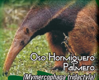
Oso Hormiguero Palmero (Myrmecophaga tridactyla)

De hábitos diurnos y nocturnos, y solitarios. Oso Hormiguero Palmero ( Myrmecophaga tridactyla ): espalda gris a pardo con tonalidades blancas, hombros, pecho y cuello con franja negra, peso de 22-39 kg, longitud de 100-120 cm, categorizado como Vulnerable (VU) por la UICN y en Apéndice II del CITES. Tamandua ( Tamandua tetradactyla ): espalda amarilla, mancha negra en vientre y hombros, peso de 3.6-8.4kg, longitud de 60-75 cm, cola prensil. Hormiguero Pigmeo ( Cyclopes didactylus ): pelaje gris-dorado, peso de 155-275 gr, longitud 15-18 cm, cola prensil. Sin reporte por la UICN y el CITES.