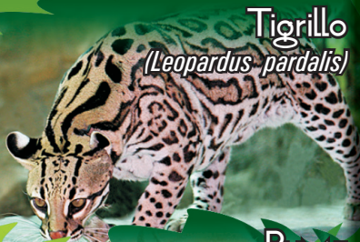
Tigrillo ( Leopardus pardalis )