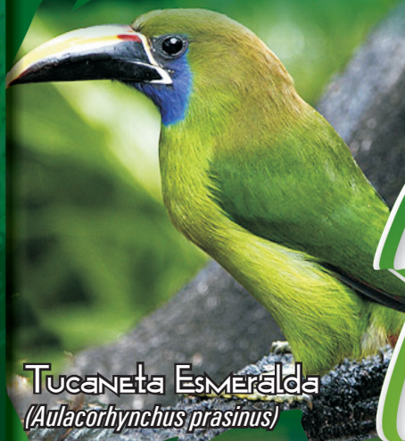
Tucaneta Esmeralda ( Aulacorhynchus prasinus )