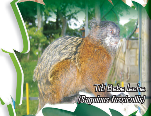
Titi Bebe Leche ( Saguinus fuscicollis )