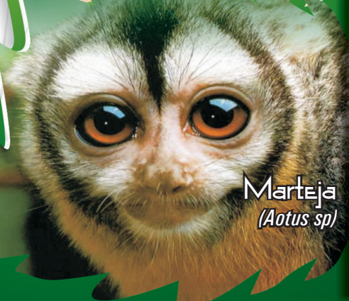
Marteja ( Aotus sp)