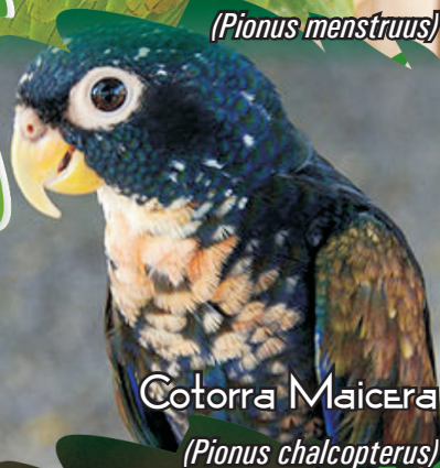
Cotorra Maicera ( Pionus chalcopterus )