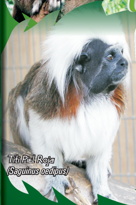
Titi Piel Roja (Saguinus oedipus)