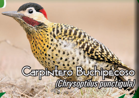
Carpintero Buchipecoso ( Chrysoptilus punctigula )