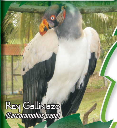
Rey Gallinazo ( Sarcoramphus papa )