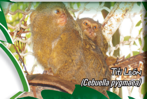
Titi LEÓN ( Cebuella pygmaea )

Arborícolas, diurnos, omnívoros y cola no prensil. Titi León ( Cebuella pygmaea ): pelaje gris a castaño en la cabeza y el cuerpo, con tonos amarillentos en la parte superior de las patas y cola con anillos negruzcos, peso 120-140 grs, longitud de 15-18 cm. Titi Ardilla ( Saimiri sciurus ): pelaje amarillento, peso 750-1100 grs, longitud 25-35 cm. Titi Bebe leche ( Saguinus fuscicollis ): peso 26 -420 grs, y de cola no prensil. No se encuentran registradas por la UICN, CITES Apéndice II.