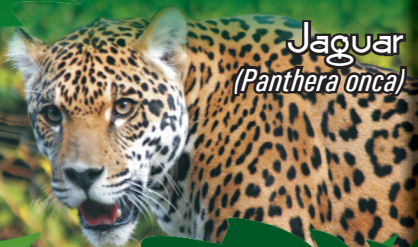
Jaguar ( Panthera onca )

De hábitos nocturnos, carnívoros y solitarios. Jaguar ( Panthera onca ): pelaje ocre-amarillo oro con manchas negras, peso 31-150 kg, longitud 220-250 cm. Puma ( Puma concolor ): pelaje canela o café, peso 29-120 kg, longitud 143 cm. Tigrillo ( Leopardus pardalis ): pelaje café amarillento, peso 11-12 kg, longitud 70-90 cm. Gato de monte ( Herpailurus yaguarondi ): pelaje negro, gris o rojizo, peso 5-7 kg, longitud 60-70 cm. Están categorizadas como Vulnerable (VU) por la UICN y en el Apéndice I del CITES.