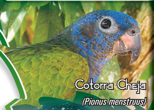
Cotorra Cheja ( Pionus menstruus )

Aves diurnas, arbóreas, que forman grupos de 5-20 ejemplares. Cotorra Cheja ( Pionus menstruus ): plumaje verde con cabeza y cuello azul. Cotorra maicera ( Pionus chalcopterus ): plumaje azul pardusco y espalda verde. Cotorra Pechiblanca ( Pionites melanocephala ): corona negra, cuello amarillo, espalda y alas verdes y abdomen blanco. Especies con peso de 220-250 gr y longitud de 24-28 cm. No se encuentran reportadas por la UICN, pero están dentro del Apéndice II del CITES.