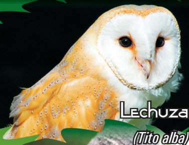
Lechuza ( Tito alba )

Aves solitarias que se alimentan de presas. Lechuza (Tito alba): plumaje blanco en cuerpo y parte superior de alas dorado y gris, cara en forma de corazón, longitud de 33-35 cm, peso de 290 - 355 gr. Búho Rayado ( Rhinoptynx clamator ) y el Búho orejudo ( Asio stygius ) y el Currucutú ( Otus choliba ): plumaje barrado, con manchas amarillentas y blancas muy finas, longitud de 20-51 cm, peso de 150-675 gr. No se encuentran reportadas por la UICN, pero están dentro del Apéndice II del CITES.