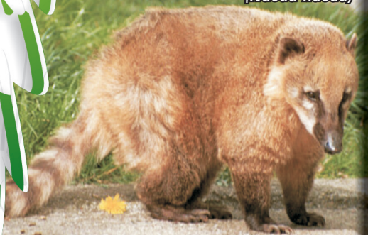
Cusumbo ( Nasua nasua )

Cusumbo ( Nasua nasua ): diurno, pelaje pardo y cola con anillos, peso de 3 – 7.2 kg, longitud de 41-67 cm. No está dentro de las categorías de la UICN pero está en el Apéndice III del CITES.