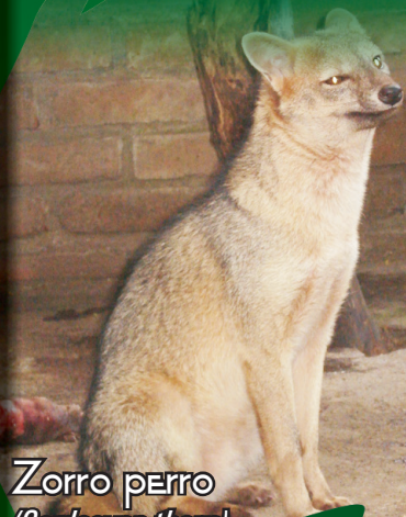
Zorro perro ( Cerdocyon thous )