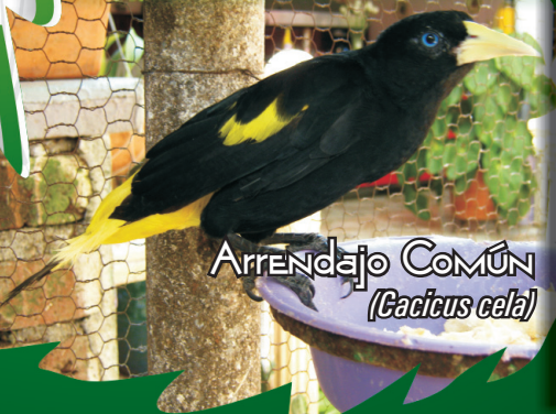
Arrendajo Común ( Cacicus cela )