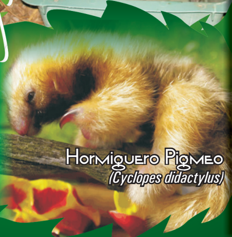
HORMIGUERO PIGMEO (Cyclopes didactylus)