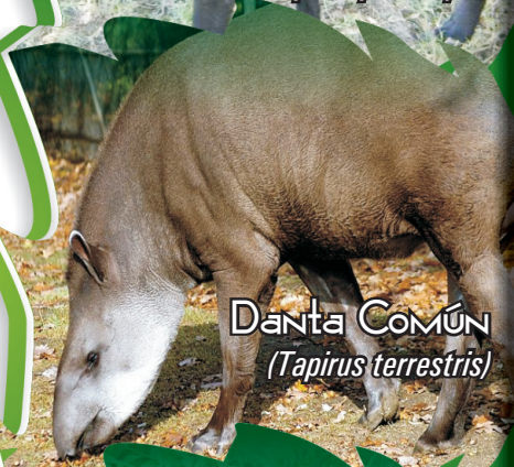
Danta Común ( Tapirus terrestris )