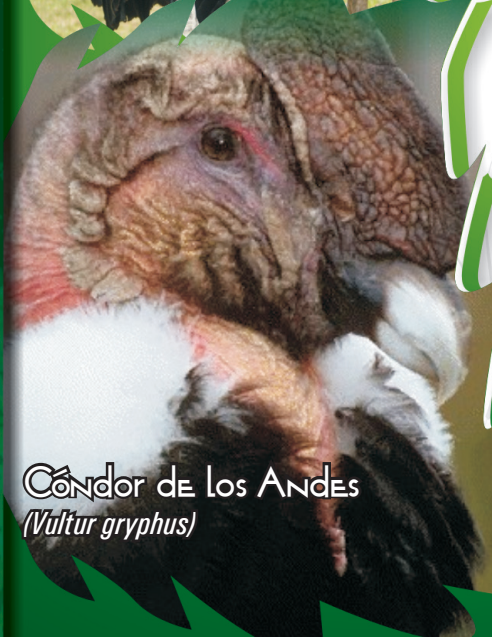
Cóndor de los Andes ( Vultur gryphus )