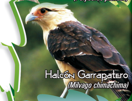
Halcón Garrapatero ( Milvago chimachima )