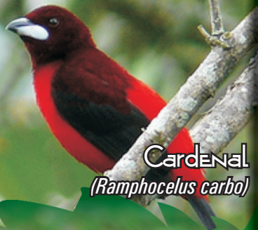
Cardenal ( Ramphocelus carbo )

Aves diurnas, forman grupos pequeños, se alimentan de granos e insectos. Cardenal ( Ramphocelus carbo ): cuerpo de color rojo, cabeza y alas más oscuro ó negro, longitud 16 cm, peso 31 gr. Canario ( Sicalis flaveola ): plumaje amarillo, coronilla naranja, longitud de 14 cm, peso 20-25 gr. Carpintero Buchipecoso ( Chrysoptilus punctigula ): plumaje amarillo oliva y barrado, frente negra y coronilla roja, longitud 20 cm, peso 30-40 gr. No se encuentran reportadas por la UICN, pero están dentro del Apéndice II del CITES.