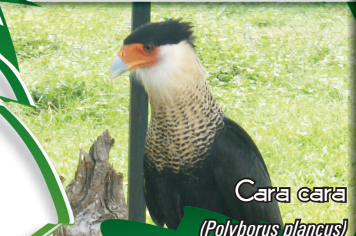
Cara cara ( Polyborus plancus )

Aves solitarias, de pico fuerte y hábitos diurnos. Cara cara ( Polyborus plancus ): parte superior de la cabeza negra, el resto de la misma y el cuello blanco grisáceo, y el dorso y pecho barrado, longitud de 55-60 cm y peso de 1 kg. Halcón Garrapatero ( Milvago chimachima ): plumaje amarillo y alas marrón, y el Halcón Gris ( Buteo magnirostris ): cabeza y dorso gris parduzco, pecho y vientre barrado; son especies con longitud de 35-40 cm, peso de 290-300 gr. No se encuentran reportadas por la UICN y el CITES.