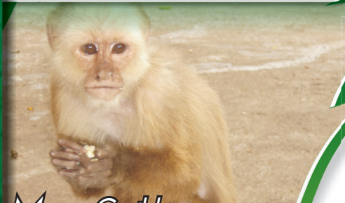
Mono Cariblanco ( Cebus albifrons )