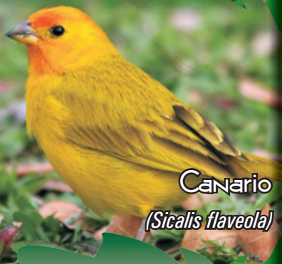
Canario ( Sicalis flaveola )