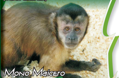
Mono Maicero ( Cebus apella )