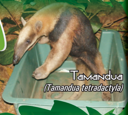
TAMANDUA (Tamandua tetradactyla)