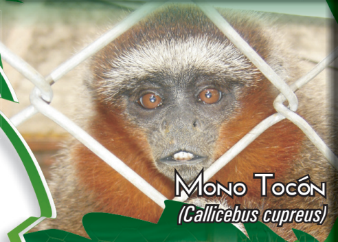
Mono Tocón ( Callicebus cupreus )

Mono Tocón ( Callicebus cupreus ): diurno, omnívoro y arborícola, pelaje café-amarillento y cejas blancas, peso 1.0-1.1 kg, longitud 30-40 cm. Mono Tocón Negro ( Callicebus torquatus ): pelaje café rojizo, café oscuro o negro, peso 0.8-1.0 kg, longitud 42-45 cm, Marteja ( Aotus sp): único mono nocturno, pelaje café claro con manchas blancas en los ojos, peso 0.8-1.0 kg, longitud 24-47 cm. Estas especies están reportadas como Vulnerable (VU), por la UICN y en Apéndice II del CITES.