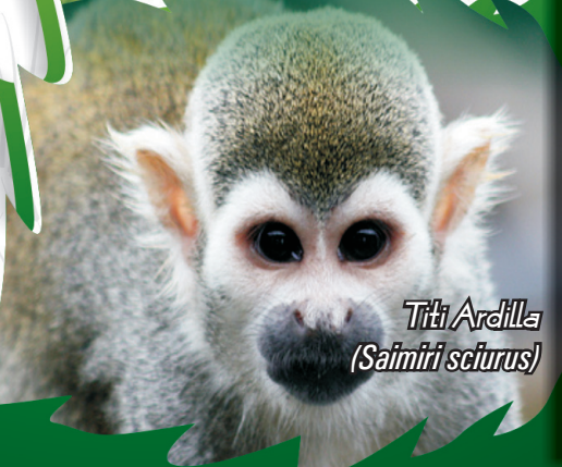
Titi Ardilla ( Saimiri sciurus )