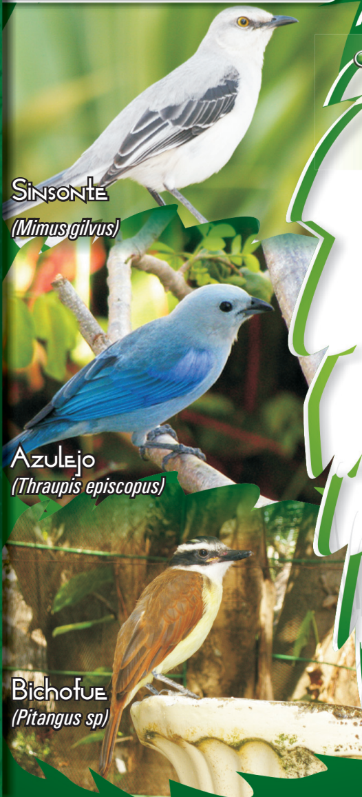
SINSONTE ( Mimus gilvus )