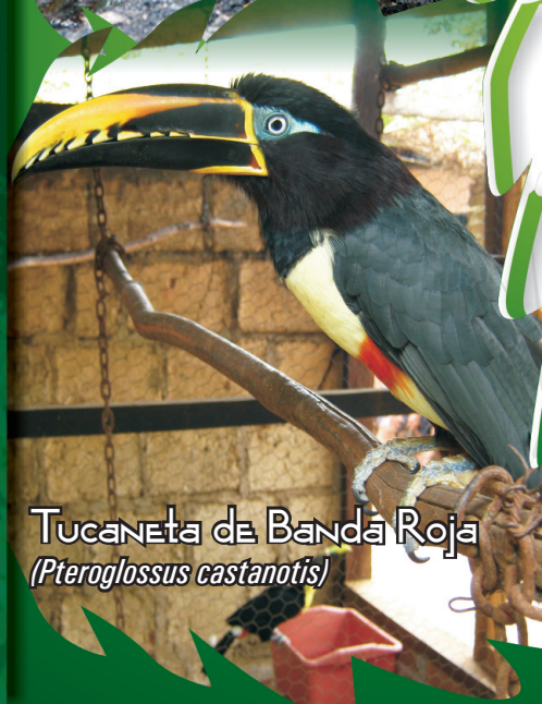
Tucaneta de Banda Roja ( Pteroglossus castanotis )

Aves de hábitos diurnos, silenciosos, de vuelo corto, forman grupos de 5-10 individuos. Tucaneta Esmeralda ( Aulacorhynchus prasinus ): Color verde brillante y cuello gris, pico negro con amarillo. Tucaneta de Banda Roja ( Pteroglossus castanotis ): plumaje verde oliva oscuro, abdomen amarillo con banda roja, pico café con amarillo. Especies con peso promedio de 180-200 gr y longitud de 30-35 cm. No se encuentran reportadas por la UICN y el CITES.