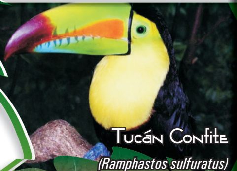
Tucán Confite ( Ramphastos sulfuratus )

Aves diurnas, omnívoras, de picos gruesos y coloridos. Tucán Confite ( Ramphastos sulfuratus ): plumaje negro, cuello y pecho amarillo, pico verde, rojo, naranja y azul. Tucán Diostedé ( Ramphastos swainsonii ): plumaje negro, cuello amarillo, pico café y amarillo. Tucán Silbador ( Ramphastos tucanus ): plumaje negro, cuello blanco, pico negro y amarillo. Especies con longitud de 18-62 cm, peso 580-750 gr. No se encuentran reportadas por la UICN, pero están dentro del Apéndice II del CITES.