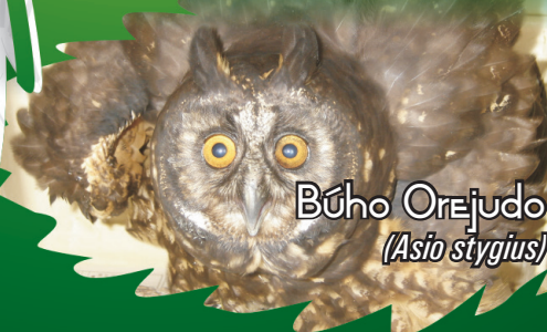
Búho Orejudo ( Asio stygius )