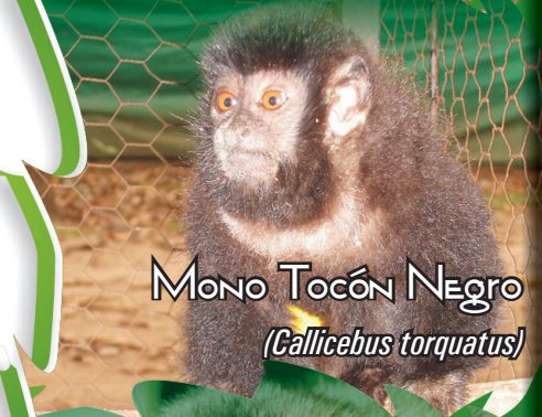
Mono Tocón Negro ( Callicebus torquatus )