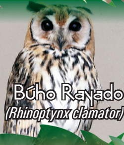
Búho Rayado ( Rhinoptynx clamator )