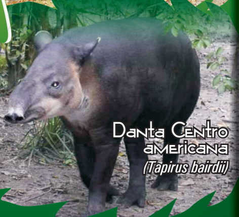
Danta Centro americana ( Tapirus bairdii )