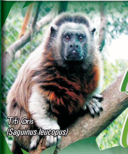
Titi Gris (Saguinus leucopus)