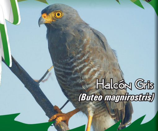
Halcón Gris ( Buteo magnirostris )